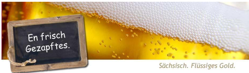
Sächsisch. Flüssiges Gold.